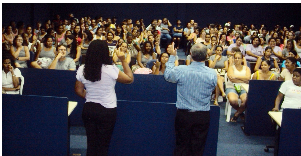
Assembleia no dia 6 de fevereiro, quando foi aprovada a pauta de reivindicação

Por isso é fundamental a participação da categoria nas assembleias e outras atividades de mobilização que forem convocadas pelo Sintvest. Fique atento e participe, pois só assim vamos conquistar o que merecemos.