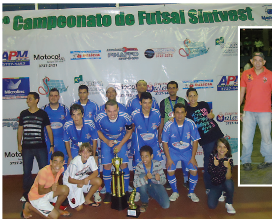
Doelinger, ao lado, e PW Brasil, acima, as campeãs de 2013

invés da Taxa Referencial (TR). A suspensão está determinada até que a primeira seção do STJ julgue um recurso decidindo se as contas do FGTS devem ser corrigidas pela inflação, em vez da TR. A suspensão, segundo o STJ, visa garantir a segurança jurídica, pois cerca de 50 mil processos tramitam em todo o país em diferentes tribunais.